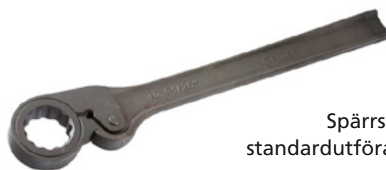
Spärrskaft i standardutförande.